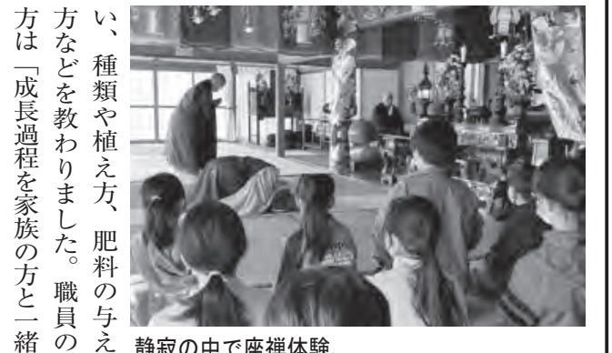
静寂の中で座禅体験

ンター中庭での昼食会や学区内のヘルスロードや鹿島神社への散歩など、季節を感じながら元気に過ごしました。 四月に入り、新一年生九名が仲間入り、上級生は優しく迎えることができました。 新五・六年生が企画進行した入学・進級を祝う会では、大型カルタなどで、交流を深めました。新型コロナウイルス感染症予防対策の徹底や災害時の避難経路の確保など、安全安心な環境を整え、十八名の指導員が交代で、六人体制で対応しています。