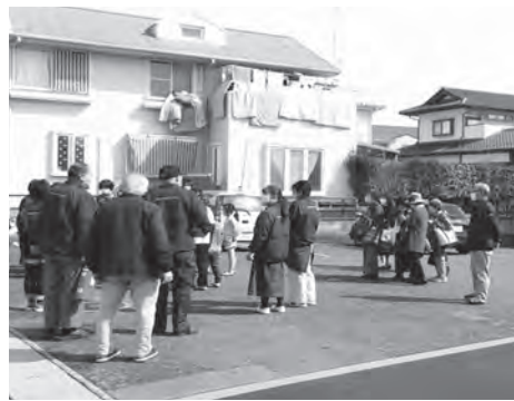
センター利用者も一緒に避難訓練

センター自衛消防訓練 消防署員の指導の下、訓練実施 三月二十七日(月)、震度六強の地震が発生、調理室からの火災により一人負傷者が出たという設定で、令和四年度第二回塙山交流センター自衛消防訓練を実施、運営委員長、事務長、協力員、児童クラブ「わくわく広場」