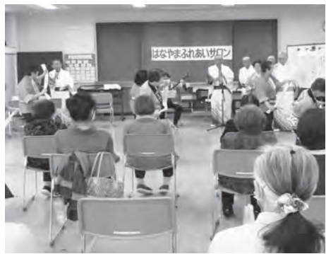
尺八の演奏に会場から拍手が贈られました

木曜サロン 民謡と踊りを楽しむ 三月二十三日の木曜サロンは、日立市民謡部メンバー十三名による、「民謡と踊りの会」を実施 学・進級を祝う会では、大型カルタなどで、交流を深めました。新型コロナウイルス感染症予防対策の徹底や災害時の避難経路の確保など、安全安心な環境を整え、十八名の指導員が交代で、六人体制で対応しています。