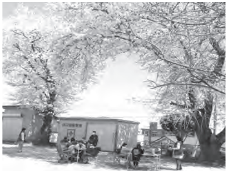
満開の桜の下で昼食

走る・投げる・跳ぶなど運動の基本を遊びの中から楽しく身につけよう ○場所 塙山小体育館又はグラウンド ○対象 1・2年生 ○日にち 塙山小及び周辺小学校児童 令和5年6月10日(土)~ 令和6年2月24日(土) 第2・4土曜日 ○時間 午前10時~11時30分 ○内容 陸上、野球、サッカー、ラグビー など専門講師が指導 ○申込み 塙山コミュニティクラブ 5月16日(火)9時~先着20名 電話又は、交流センター直接 ○TEL 34-5431