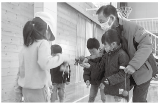
名人に教えてもらいけん玉に挑戦

一月十六日の羽根つこゲーム。このゲームは羽の付いた駒を赤白に区別された的に滑らせるように手で投げて得点を競うゲームでした。赤チームは赤い駒に、白チームは白い駒に駒が乗らなければ、点数になりません。ただ投げるだけではないので、難しいようでしたが、楽しめたようで、時折笑い声や、歓声があがっていました。