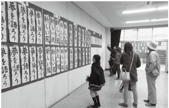
受賞作品を記念撮影

ている学習や書写、読み聞かせ、クラブ、環境整備、安全面等での学校支援事業を写真で紹介するコーナーと塙山小マンガ・絵画クラブ児童の絵手紙作品も併設、普段見ることができない学校支援の内容を知ることができ好評でした。