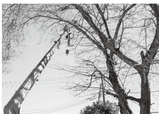
高所作業車でカラスの巣を撤去

交流センター中庭の桜の木に、昨年夏ごろからカラスが巣を作っていました。鳥獣保護法の関係で、子育てが終わった今年一月十四日(火)に巣の撤去を行いました。