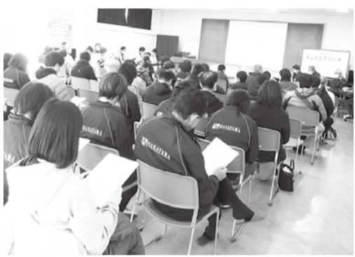
昨年の3.11防災訓練の様子

阪神淡路大震災から三〇年、東日本大震災から十四年、台風十三号豪雨から一年半、昨年は能登半島地震、千葉県沖震源地震、南海トラフ巨大地震注意(日向灘地震)、茨城県北部震源連続地震、能登半島集中豪雨などの自然災害に襲われた。「災害は忘れる前にやって来る」「備えあれば憂いなし」の災害頻発時代。塙山学区では昨年「3.11東日本大震災9.08豪雨災害を忘れない防災訓練」として幅広い訓練を目指し、今