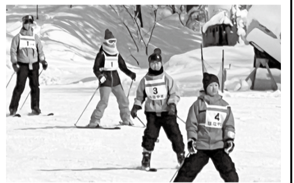
斜面をスイスイ滑ります

スキー教室二〇二四 スキー初心者も滑れるように 二月一日(土)、二日(日)一泊二日で塙山コミュニティクラブ