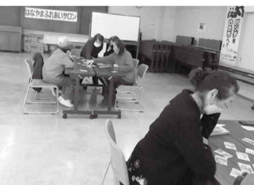
読み手の声に耳を澄ませて